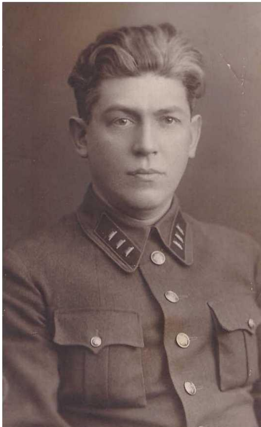
Фото 3. Георгий Григорьевич Карпов - Советский государственный деятель, генерал-майор НКГБ. С сентября 1943 по февраль 1960 года - председатель Совета по делам Русской православной церкви при Совете народных комиссаров СССР