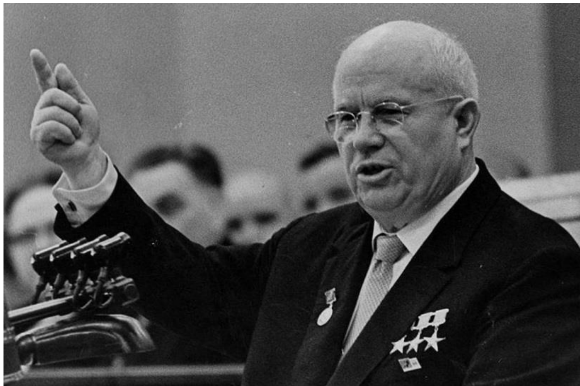
Фото 2. Никита Сергеевич Хрущев - Первый секретарь ЦК КПСС с 1953 по 1964 годы, Председатель Совета Министров СССР с 1958 по 1964 годы