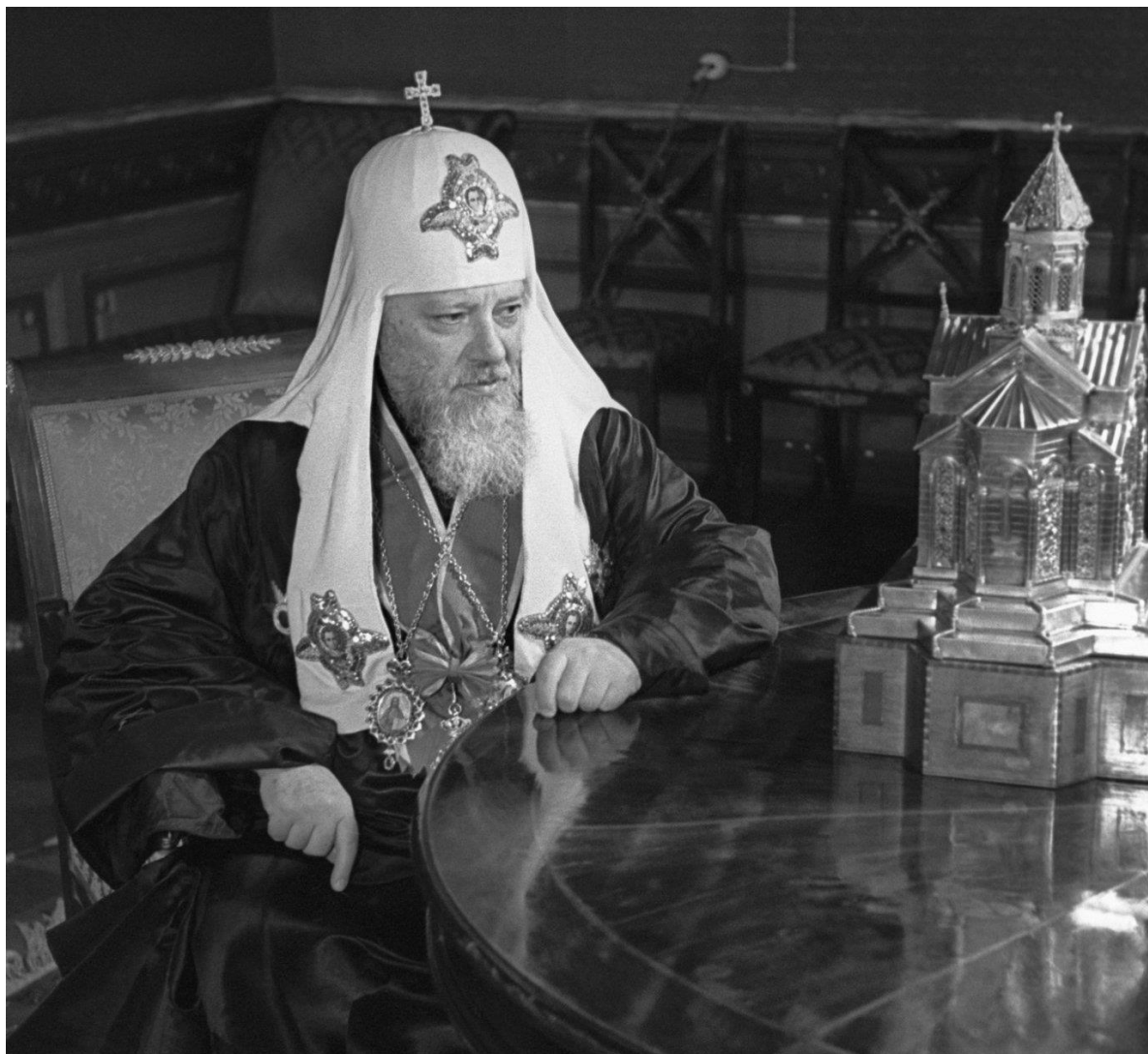
Фото 1. Патриарх Московский и всея Руси Алексий I (Симанский)