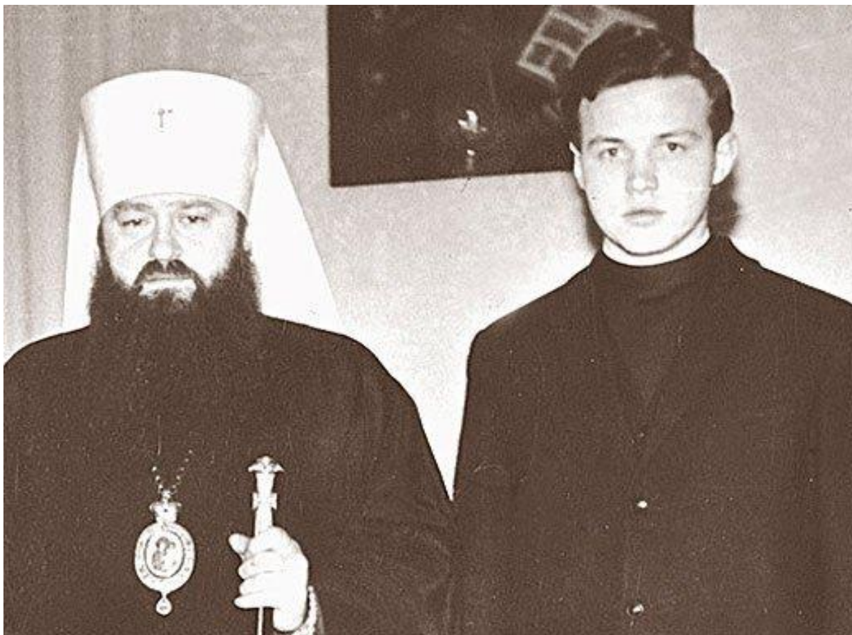
Фото 5. Митрополит Никодим (Ротов). С 1960 по 1972 год председатель отдела внешних церковных сношений Московской патриархии