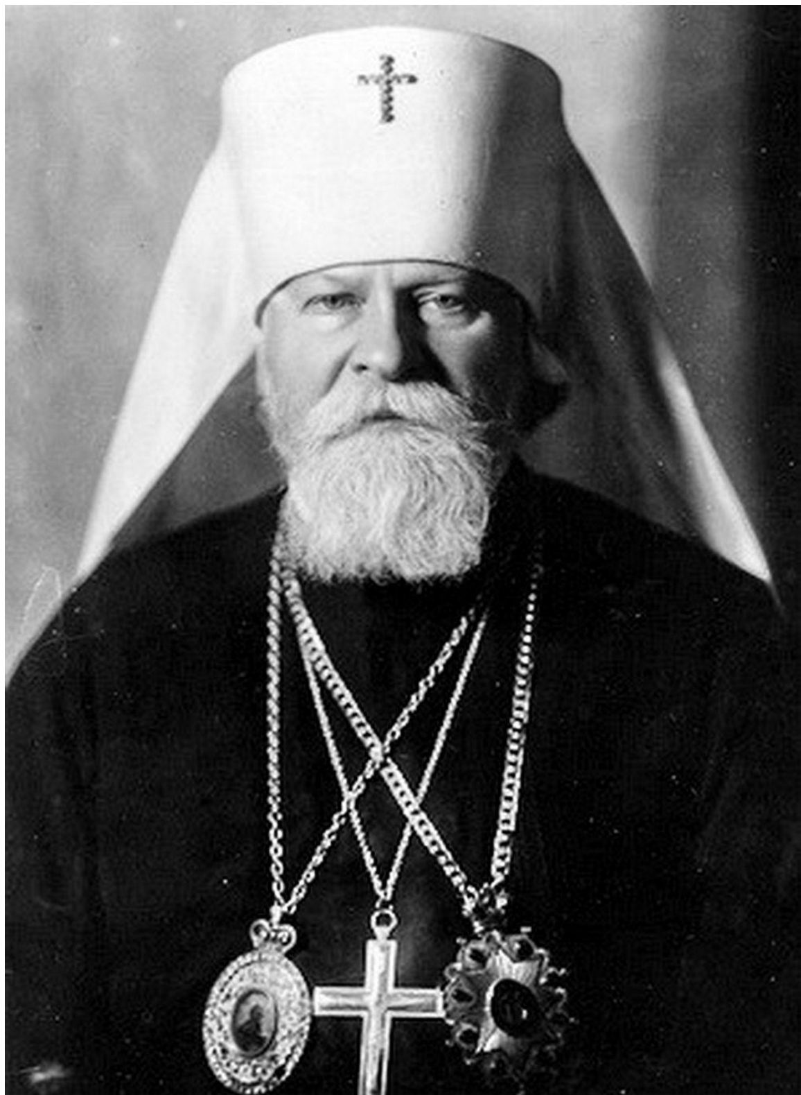
Фото 4. Митрополит Николай (Ярушевич). Был первым Председателем Отдела внешних церковных сношений: с апреля 1946 до июня 1960 года